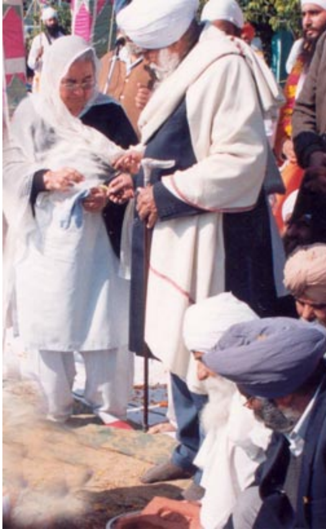
ਗੁਰਦੁਆਰਾ ਈਸ਼ਰ ਪ੍ਰਕਾਸ਼ ਰਤਵਾੜਾ ਸਾਹਿਬ ਦੇ ਸ਼ਿਲਾਨਿਆਸ ਸਮੇਂ ਸੰਤ ਮਹਾਰਾਜ ਰਤਵਾੜਾ ਸਾਹਿਬ ਵਾਲੇ ਪਰਮ ਸਤਿਕਾਰਯੋਗ ਬੀਜੀ ਜੀ ਤੋਂ ਨੀਂਹ ਵਿੱਚ ਚਾਂਦੀ ਦੇ ਰੁਪਏ ਰਖਵਾਉਂਦੇ ਹੋਏ।

ਇਹ ਇਕ ਬਹੁਤ ਵੱਡੀ ਸਫਲਤਾ ਸੀ ਜਿਸ ਦੇ ਸਿੱਟੇ ਵੱਜੋਂ ਇਨ੍ਹਾਂ ਨੂੰ ਸਿੱਖੀ ਨਾਲ ਐਤਨਾ ਪਿਆਰ ਹੋਇਆ ਕਿ ਮਹਾਂਪੁਰਖਾਂ ਨੂੰ ਸਮਾਗਮਾਂ ਵਿੱਚ ਸ਼ਾਮਲ ਹੋਣ ਵਾਲੇ ਪ੍ਰੇਮੀਆਂ ਲਈ 1000X240 ਫੁੱਟ ਦੇ ਮਹਾਨ ਪੰਡਾਲ ਹਰ ਸਾਲ ਲਾਉਣੇ ਪਏ। 300x180 ਫੁੱਟ ਦੇ ਵਿਸ਼ਾਲ ਪੰਡਾਲ ਲੰਗਰ ਛਕਣ ਵਾਲਿਆਂ ਲਈ ਲਾਉਣੇ ਪਏ ਜਿਥੇ ਇਕ ਘੰਟੇ ਵਿੱਚ 18000 ਤੋਂ ਵੱਧ ਪ੍ਰੇਮੀ ਲੰਗਰ ਛਕ ਜਾਂਦੇ ਸਨ। (ਮਹਾਂਪੁਰਖਾਂ ਦੀ ਚਲਾਈ ਪ੍ਰਪਾਟੀ ਅਨੁਸਾਰ ਹੁਣ ਵੀ ਇਹ ਸਮਾਗਮ ਆਉਣ ਵਾਲੀ ਮਿਤੀ 28, 29, 30 ਅਤੇ 31 ਅਕਤੂਬਰ ਨੂੰ ਰਤਵਾੜਾ ਸਾਹਿਬ ਦੀ ਮਹਾਨ ਤਪੋ ਭੂਮੀ ਉਪਰ ਮਹਾਂਪੁਰਖਾਂ ਦੀ ਬਰਸੀ ਦੇ ਰੂਪ ਵਿੱਚ ਮਨਾਏ ਜਾਂਦੇ ਹਨ। ਜਿਸ ਵਿੱਚ ਮਹਾਂਪੁਰਖਾਂ ਨੂੰ ਪਿਆਰ ਕਰਨ ਵਾਲੇ ਅਨੇਕਾਂ ਦੇਸ਼ ਵਿਦੇਸ਼ਾਂ ਤੋਂ ਪ੍ਰੇਮੀ ਰਤਵਾੜਾ ਸਾਹਿਬ ਪਹੁੰਚ ਰਹੇ ਹਨ। ਸਾਡੇ ਕੋਲ ਈਮੇਲ ਟੈਲੀਫੋਨ, ਮੋਬਾਇਲ ਫੈਕਸ ਰਾਹੀਂ ਸਨੇਹੇ ਆ ਰਹੇ ਹਨ, ਉਨ੍ਹਾਂ ਦੀ ਦੇਖ ਰੇਖ ਯੋਗ ਰਿਹਾਇਸ਼ ਦਾ ਪ੍ਰਬੰਧ ਰਤਵਾੜਾ ਸਾਹਿਬ ਕੰਪਲੈਕਸ ਅੰਦਰ ਹੀ ਕੀਤਾ ਗਿਆ ਹੈ, ਤਾਂ ਜੋ ਸੰਗਤਾਂ ਚਾਰ ਦਿਨ ਦੇ ਸਮਾਗਮ ਦਾ ਪੂਰਾ ਪੂਰਾ ਲਾਹਾ ਉਠਾਇਆ ਜਾ ਸਕੇ। ਸਮਾਗਮ ਦਾ ਪ੍ਰੋਗਰਾਮ